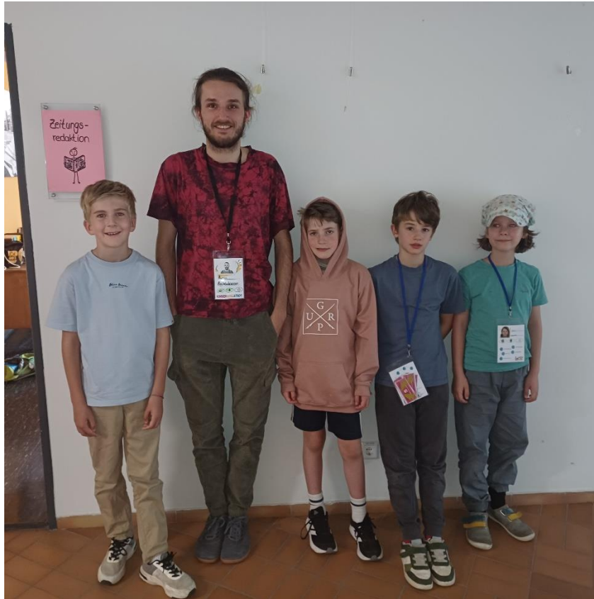
Auf dem Foto ist ein Teil der Redaktion